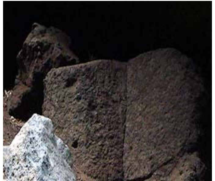
detail calle jonsitos