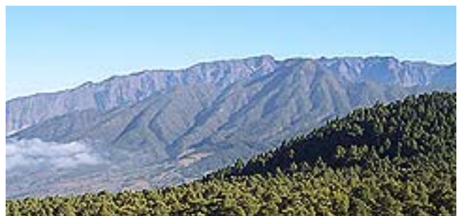
blick von süden auf die caldera